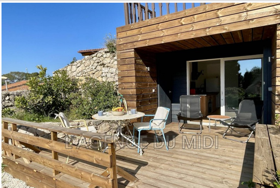
Studio LEUCATE VILLAGE

...cles de rue. - En juillet : Festival de musique LES DEFERLANTES SUD DE FRANCE à LE BARCARES. Au programme, de nombreux artistes venus du monde entier ( A 10km ). - De novembre à janvier: LE VILLAGE DE NOEL à LE BARCARES déploie sa magie à quelques mètres de la Méditerranée pour le plus grand plaisir des petits comme des grands ( A 10km ). - Toute l'année: La Réserve Africaine de SIGEAN, grand parc animalier ( A 20km ). - Réf. : 730L60A - Mandat n°730L60A